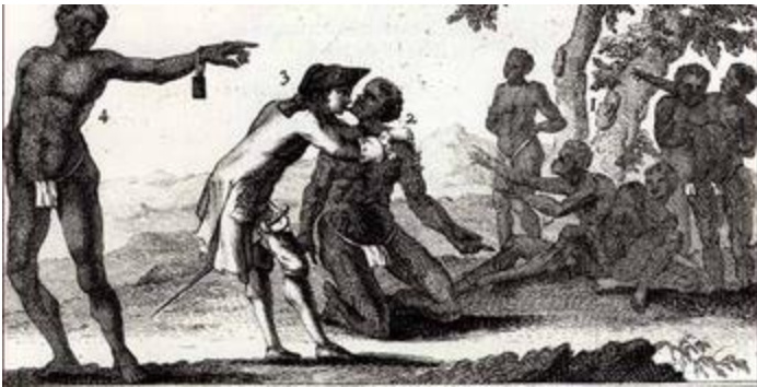
Painting Title: An Englishman Tastes the Sweat of an African