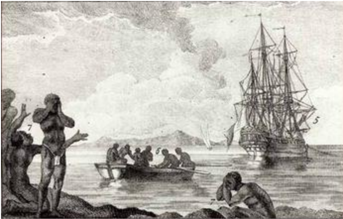
Painting Title: A View of Calabar