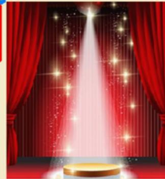
TEATRO IPEM 37