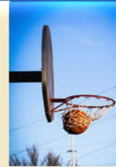
ARO DE BASQUET