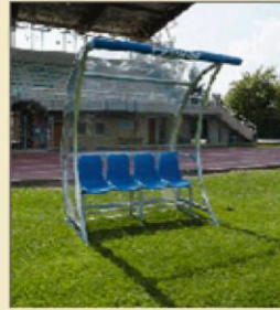
BANCO DE SUPLENTE