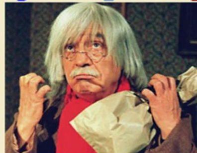
¡TE OLVIDASTE DEL GUIÓN!